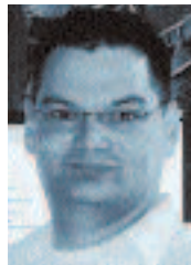
MARKUS POPP Sample GmbH

Medialeistung kann nach verschiedenen Kriterien visualisiert werden. Kunden können in Zukunft noch besser dokumentiert werden. Bleibt zu hoffen, dass diese neuen Möglichkeiten auch zusätzliche Argumente pro Radio liefern und die eine oder andere zusätzliche Kampagne daraus resultiert.